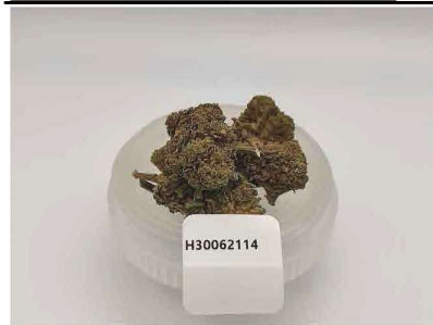
Foto del campione

Grado di umidità al momento dell'analisi - 8.58%